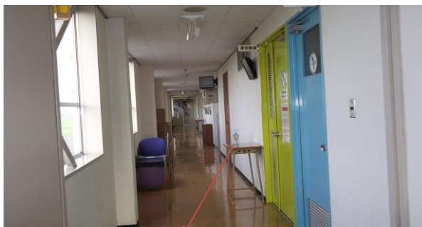
第4教室の設置状況

従来、教室内に置いた消毒液を教室外に出し、入退室及び通行する際、自由に手を消毒できるように整備した。