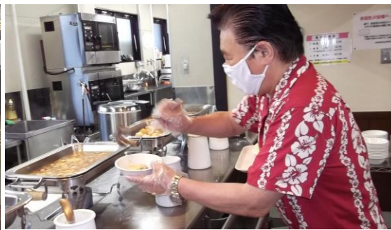
マスク及び手袋をしておかず等を取る様子