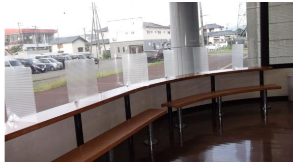
駐車場側カウンター7席のパーティーションの状況