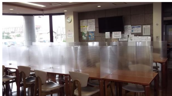
食事用テーブル28席のパーティーションの状況