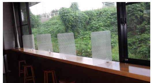
国道側カウンター5席のパーティーションの状況