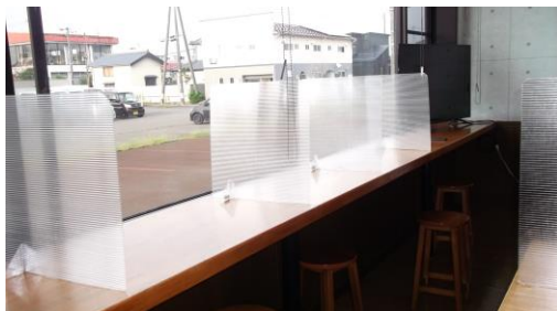
駐車場側カウンター5席のパーティーションの状況