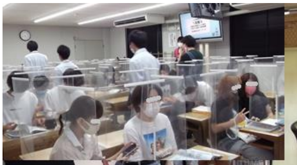
パーティーション

また、パーティーションの影響で、教材を写すテレビが見えにくくなったことからテレビを2台増設し、既存のテレビとともに、2×4材を利用し上部に設置し見やすいように整備した。