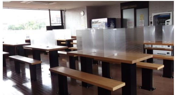
食事用テーブル36席のパーティーションの状況