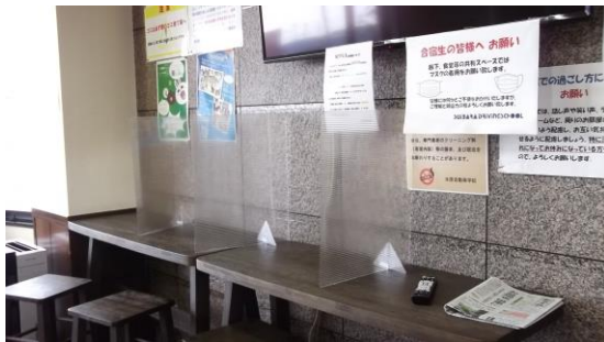
テレビ下カウンター4席のパーティーションの状況