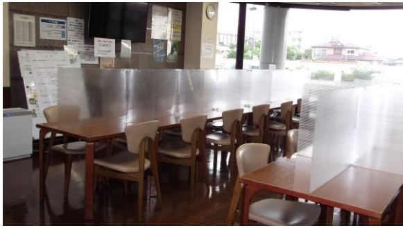
食事用テーブル28席のパーティーションの状況