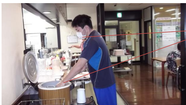
マスク及び手袋をしてご飯を盛る様子