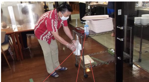
ビニール手袋 消毒液 ティッシュペーパー