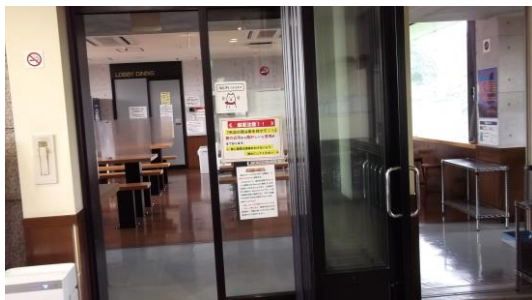
旧女性寮側の食堂入り口

食事用テーブル36席、駐車場側のカウンター5席、国道側カウンター5席に、それぞれをパーティーションで区切り、感染予防対策を図った。