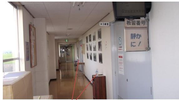
第3教室の設置状況